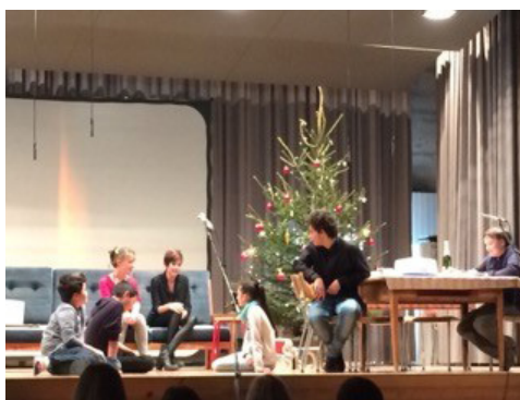
il giug da Natal

Ils 21 da december eis ei puspei stau aschi lunsch: La sera da Nadal ha giu liug en casa da scola communal a Rueun. Tras la sera han scolars e scolaras dalla 2. reala menau, quei a moda fetg simpatica. Ils scolars e las scolaras dall'emprema secundara e reala han presentau in cuort toc da teater ed ils scolars e las scolaras dalla 3. secundara e reala ina historia da Nadal sco giug auditiv cun fotografias.