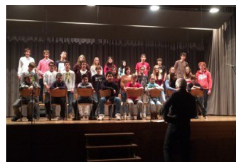
tuttas classas cantein enzemen

Ils scolars e las scolaras da tuttas classas han presentau ensemen duas canzuns da rock e pop, quei ch'ei vegniu arrundau cun la canzun „Clara notg“, cantada da tut ils presents communablamein. Secapescha ei la sera aunc buc stada alla fin suenter las producziuns.