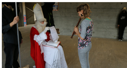
sunar in toc pil Sontgaclau

Il venderdis eis ei aschi lunsch: Suentar rimnar a moda speditiva tut ils scolars, prelegia il Sontgaclau ord il cudisch dalla verdad. Buns scolars vegnan remunerai, ils meins buns vegnan mess el sac e transportai naven. Tuts astgan vegnir anavon tier Sontgaclau.